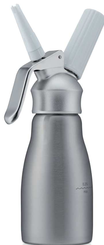
WHIPcreamer SYMPHONIE 0,25 L Art.Nr. 4525

Ouvrez, avec le WHIPcreamer SYMPHONIE, la porte vers un nouveau monde de délices et composez avec lui des sauces délicieuses, des crèmes délicates et des desserts tentants. Cet appareil est un élément indispensable dans la cuisine légère d'aujourd'hui et allie, grâce à sa finition haut de gamme, les possibilités de la gastronomie professionnelle avec les exigences de votre ménage. Le corps de la bouteille est en acier inox de haute qualité, la tête est réalisée avec un alliage d'aluminium estampé extrêmement résistant et a reçu un traitement de surface spécial. Le WHIPcreamer SYMPHONIE introduit ainsi une qualité professionnelle dans votre cuisine. Le WHIPcreamer SYMPHONIE est tellement facile à manier que vous aurez un plaisir fou à travailler avec lui et il vous assure de surcroît une longue conservation de vos préparations dans votre frigidaire.