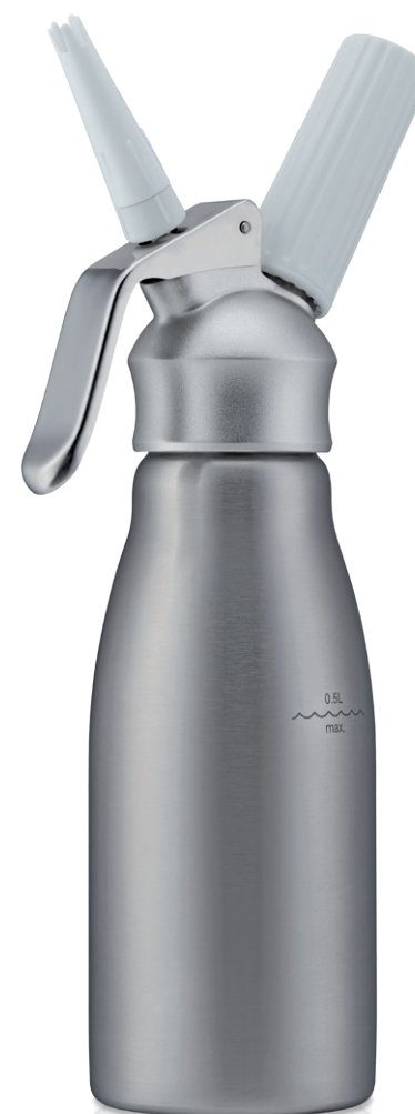
WHIPcreamer SYMPHONIE 0,5 L Art.Nr. 4550

S WHIPcreamer SYMPHONIE otevřete bránu do zbrusu nového světa chutí a vytvoříte lahodné omáčky, jemné krémy a neodolatelné zákusky. Tento pomocník je ideální pro dnešní lehčí styly vaření a díky svému elegantnímu vzhledu dodá vaší kuchyni romantiku vybraného stolování. Lahev šlehače je z ušlechtilé nerezové oceli a hlava je vyrobena ze silného zápusťového výkovku z hliníkové slitiny se speciální povrchovou úpravou. WHIPcreamer SYMPHONIE vnáší do vaší kuchyně profesionální kvalitu v pohodlné domácí velikosti. S lehce ovladatelným šlehačem WHIPcreamer SYMPHONIE zažijete skvělou zábavu, až budete kouzlit rozmanité lahodné pokrmy – a jeho obsah zůstane déle čerstvý ve vaší chladničce.